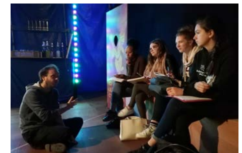
Rencontre avec les élèves de 1ère SAPAT Lycée agricole de Caulhès - 10/2019