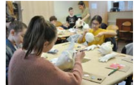
Réalisation de marionnette Collège de Sizun - 01/2020