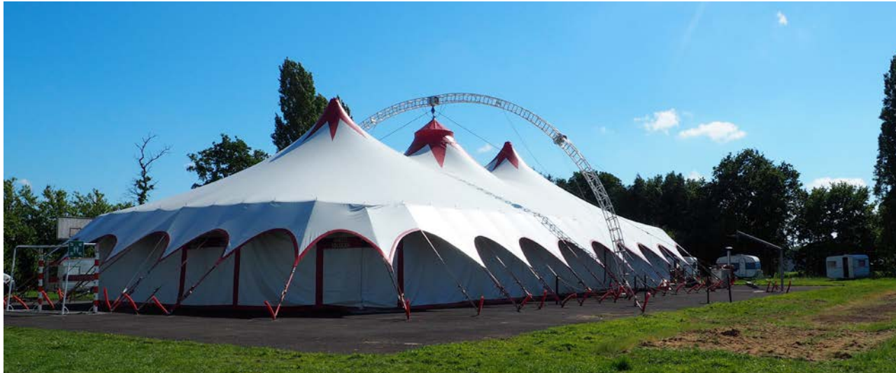
Chapiteau de la Compagnie OCUS - antre du Dédale Palace

Pour continuer à s'inscrire dans le mouvement du théâtre forain, la Compagnie OCUS s'est équipée d'un espace plus adapté à son rapport public et à l'envergure du nouveau projet : un chapiteau rectangulaire (30mx15m). Pour ce spectacle, il sera donc Le Dédale Palace, start-up foraine innovante qui propose des expériences sur mesure. Une fête foraine un peu étrange où se mêlent vulgarité et poésie, datas et liberté. Les spectateurs sont donc les consommateurs (presque) consentants d'attractions embrouilleuses qui enregistrent tout sur tout le monde.