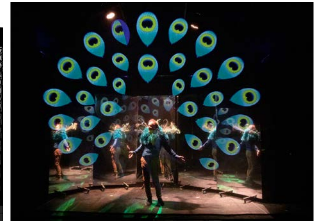
Projection sur tulle

Cette machinerie mélangeant technologie numérique et artisanat continuera à troubler les sens du spectateur.