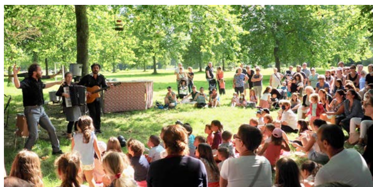
Fête de l'étang - Bourgbarré (35) - 2021