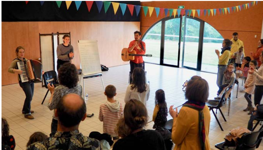
Transmission de chant - Mon petit festival - Gétigné (44) - 2021