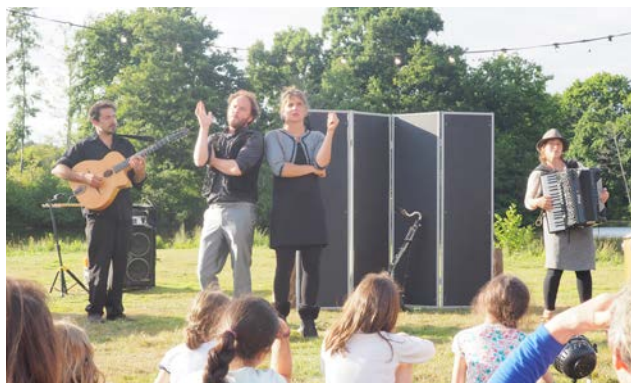
Mon petit festival - Gétigné (44) - 2021

Public : Public familial à partir de 3 ans.