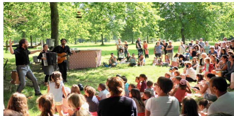
Fête de l'étang - Bourgbarré (35) - 2021

Public : Public familial à partir de 3 ans.