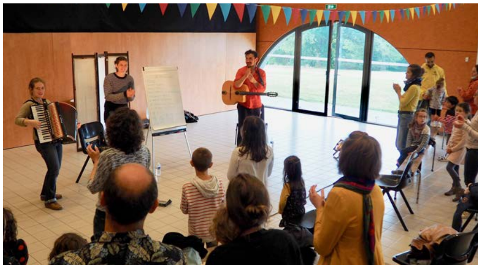
Transmission de chant - Mon petit festival - Gétigné (44) - 2021